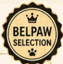
TABLA COMPARATIVA DE MODELOS

El parque debe estar en una zona limpia, tranquila pero cercana a la actividad familiar para que el cachorro no se sienta aislado.